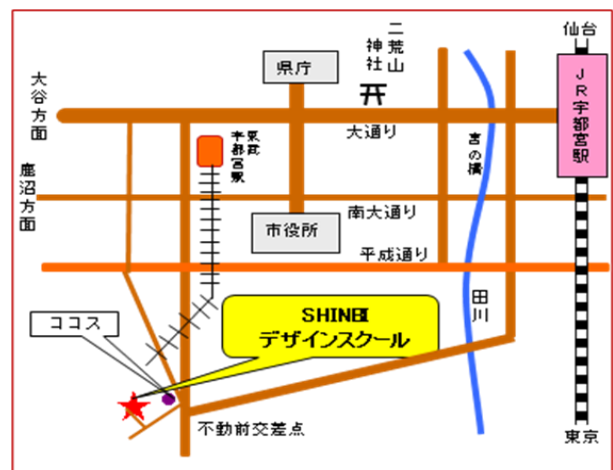
(訓練実施場所) SHINBI デザインスクール