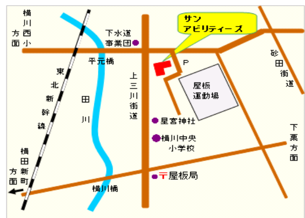
(訓練実施場所) 宇都宮市 サン・アビリティーズ