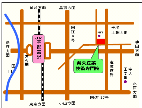
(選考会場) 県央産業技術専門校